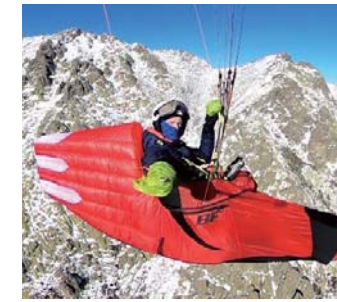
コクーン V3 GT