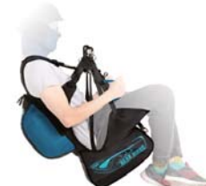
タンデムパイロット タンデムパッセンジャー