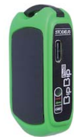
ビープビーププロ V2