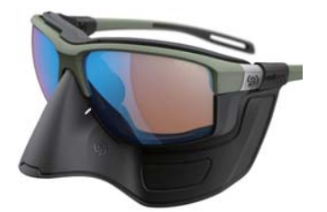
e047 - エクストリーム