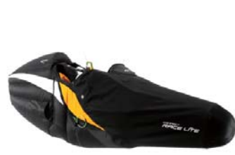
コネクトレースライト